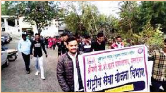
Awareness Rally On Save Girl & Teach Girl on Dated 06/01/2022