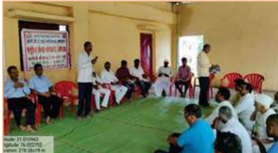
NSS - Gramwahan Katta Inauguration At. Hartale on Dated 07/10/2021