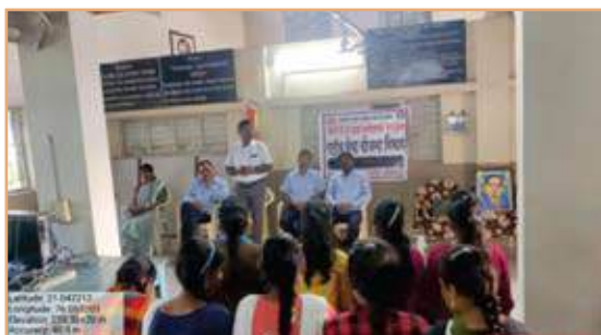
Indian Constitution Day on Dated 26/11/2021