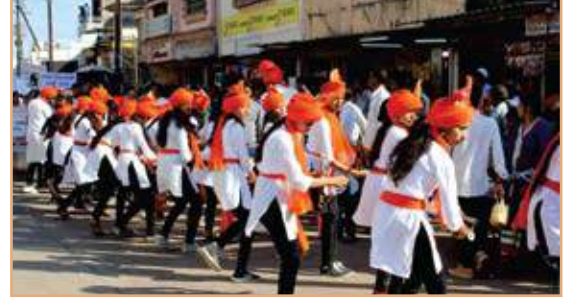
लेझीम प्रशिक्षण घेत असतांना महाविद्यालयातील विद्यार्थी