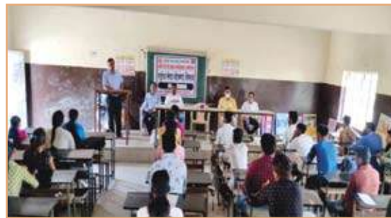
World Aids Day on Dated 01/12/2021