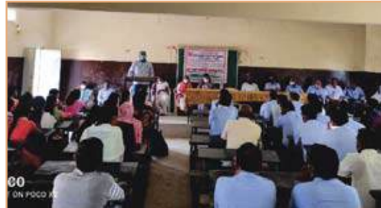
Corona Vaccination Camp on Dated 29/10/2021