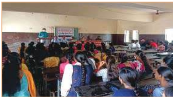
Voter Campaign on Dated 25/11/2021