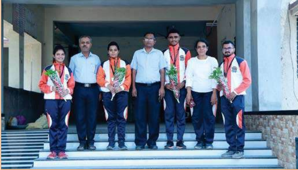
अखिल भारतीय पातळीवर विविध क्रिडा प्रकारात सहभागी विद्यार्थी