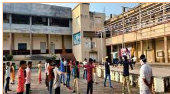
Yoga Training on Dated 05/12/2021