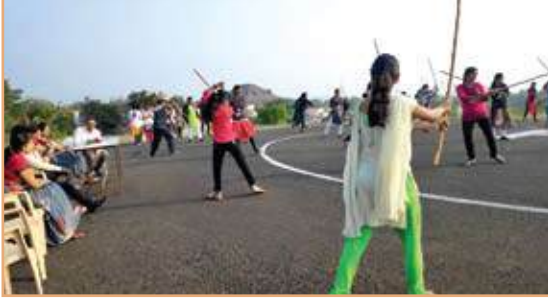
लाठी प्रशिक्षण घेत असतांना महाविद्यालयातील विद्यार्थीनी