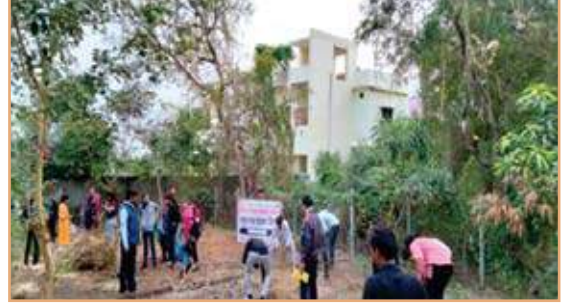
Clean India Mission on Dated 02/01/2022