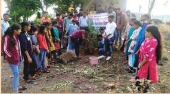
Tree Plantation on Dated 19/12/2021