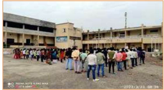
तंबाखूमुक्त भारत अभियानांतर्गत शपथ घेताना महाविद्यालयाचे प्राचार्य, उपप्राचार्य व प्राध्यापकवृंद व विद्यार्थी