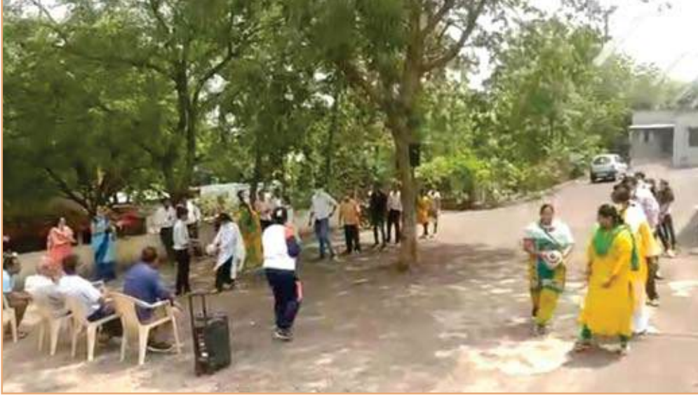
राष्ट्रीय क्रिडादिन साजरा करतांना प्राध्यापक व विद्यार्थी